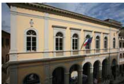
Sede di Jesi - Palazzo Ghislieri